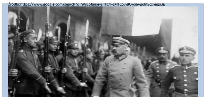
Zdjęcie ilustracyjne / reprodukcja: Piotr Mecik